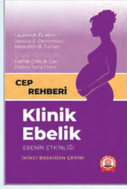
Klinik Ebelik Ebenin Etkinliği Hafize Öztürk Can Nazan Oran