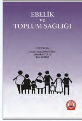
Ebelik ve Toplum Sağlığı Melek Gülsün Özentürk Ummahan Yücel Recı Meserı