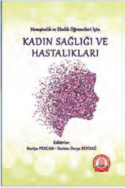
Kadın Sağlığı ve Hastalıkları Nuriye Pekcan Kerime Derya Beydağ